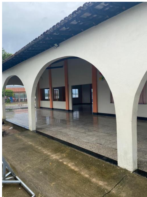
Figura 5 - Vista interna da edificação