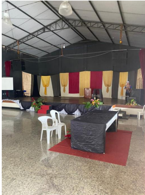
Figura 4 – Vista do salão de eventos