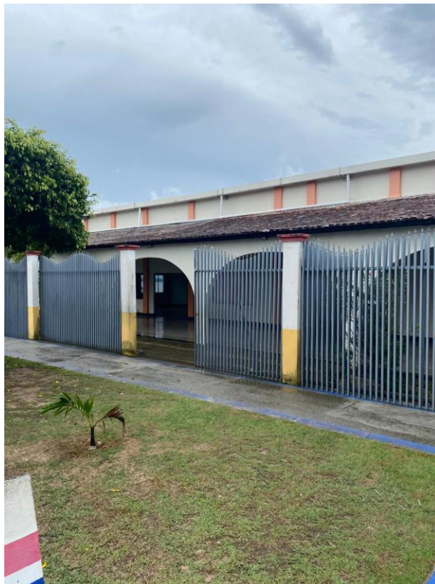
Figura 1 - Vista frontal da edificação