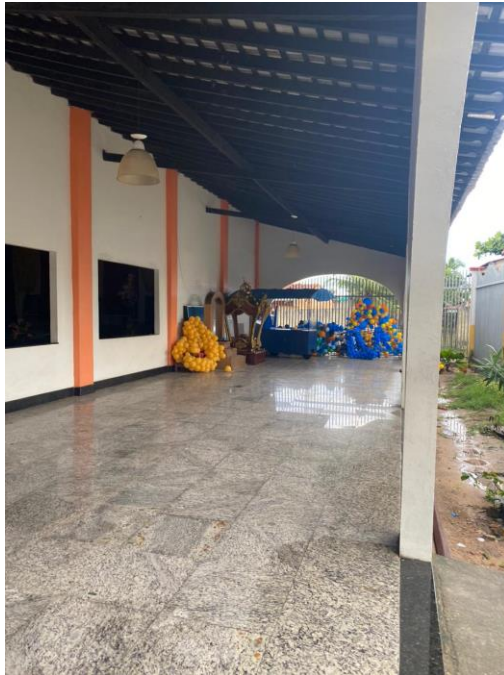
Figura 2 – Vista da área de vivência