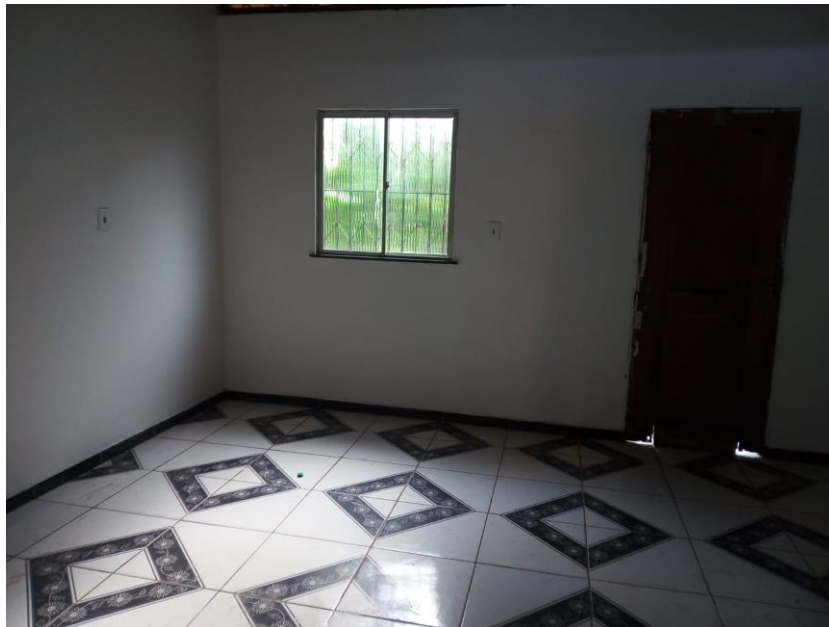
Figura 6 - Vista da cozinha do imóvel