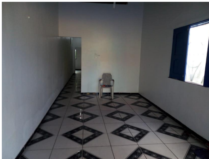
Figura 3 - Vista da sala de estar do imóvel