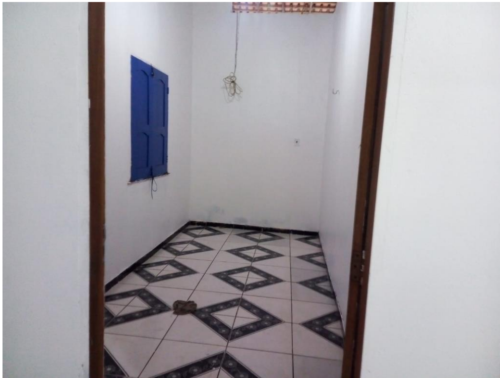
Figura 4 – Vista do quarto do imóvel