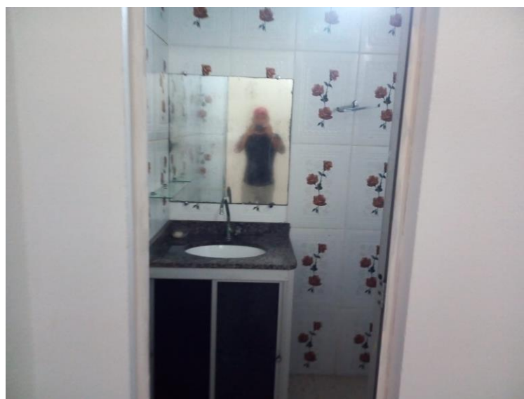
Figura 5 - Vista do banheiro do imóvel