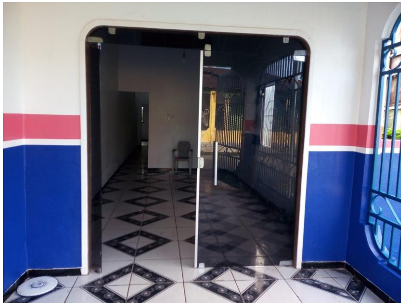
Figura 2 – Vista do pátio do imóvel